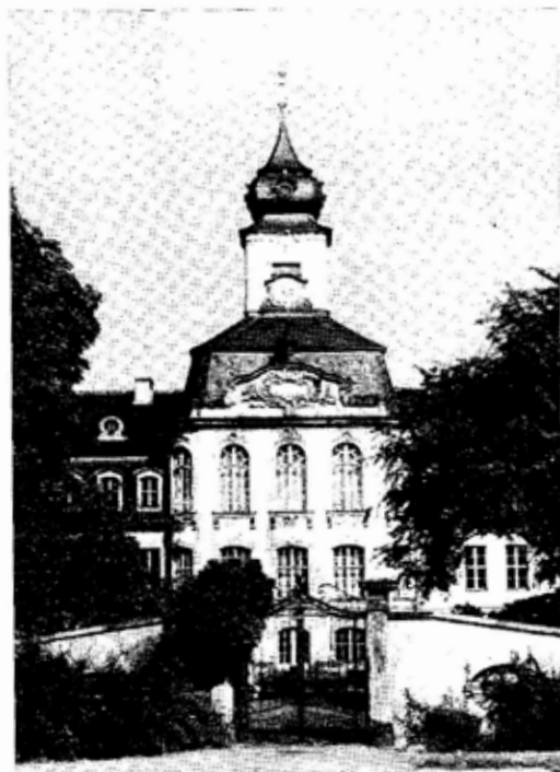
Das Gohliser Schloßchen in Leipzig – Heimstatt des Bach-Archivs der DDR (unten ein Innenraum)